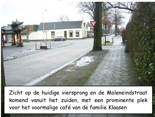
Zicht op de huidige viersprong en de Moleneindstraat komend vanuit het zuiden, met een prominente plek voor het voormalige café van de familie Klaasen