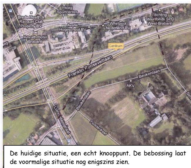
De huidige situatie, een echt knooppunt. De bebossing laat de voormalige situatie nog enigszins zien.

De nu beboste groenstrook die u op de foto ziet vormde een deel van die Ypelaarschestraat. Op de foto van de huidige situatie vanuit de lucht gezien, ziet u ook nog het deel aan de overzijde van de zuidelijke rondweg. Volg de stippellijnen.