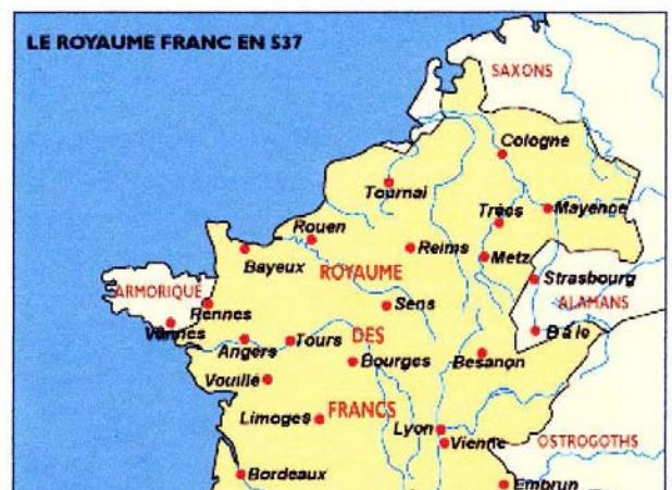
De Romeinen waren niet langer de baas. De streek waar we nu wonen lag in het Koninkrijk Frankrijk in 537 na Christus.

Op bovenstaand kaartje van begin vorige eeuw is de situatie van vóór de aanleg van Heerbaan en Claudius Prinsenlaan goed te zien. De Heusdenhoutseweg, toen nog Hoogeindseweg genoemd, buigt er sterk af in zuidelijke richting. Daar sluit de weg aan op de Valkeniersdreef, later Valkenierslaan genoemd, richting Ginneken. Het was een knooppunt van wegen. Ook de Molenlei stroomde daar in die tijd.