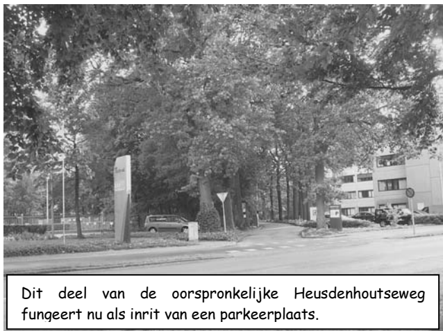
Dit deel van de oorspronkelijke Heusdenhoutseweg fungeert nu als inrit van een parkeerplaats.

Ook nu nog kunt u enigszins zien hoe het vroeger was. Wanneer u de Heusdenhoutseweg in zuidelijke richting volgt, gaat de weg ter plaatse van de Weilustlaan over van straatweg in fiets- en voetpad. Vroeger was ook dat tracé een deel van de oorspronkelijke Heusdenhoutseweg. Van het sterk afbuigende wegdeel van vroeger is nu nog een stukje te zien, zie foto. Het ligt aan de overzijde van de Heerbaan en vroegere Heusdenhoutseweg. Dat stukje weg fungeert nu als oprit naar de parkeerplaats van het kantoorgebouw met de luxe naam 'Heerendaal'.