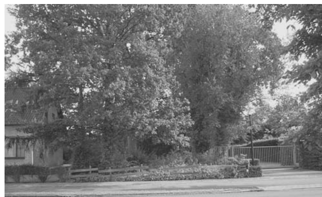
Nu ondoordringbaar, vroeger een deel van de IJpelaarsestraat, de weg van Heusdenhout naar Bavel.

woonhuis met huisnummer 154 en het kantoorgebouw van MEE.