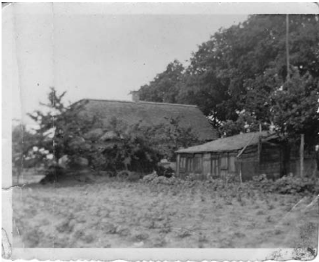
De herbouwde tuinderswoning van de familie van Hal. In de zestiger jaren van vorige eeuw afgebroken.

naast nog enkele andere percelen in gebruik die elders lagen. Toen was het geheel in gebruik als boerderij, later als tuinderij.