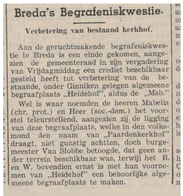
Het Nieuws van de Dag 11 april 1939: Ook toen al geruchtmakende kwesties in de Bredase gemeenteraad.