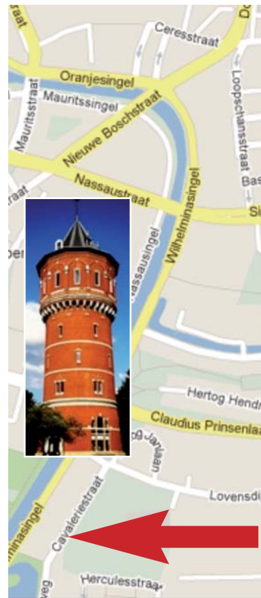
Bij de pijl de begraafplaats, ten noorden er van de koepelgevangenis. Op dezelfde plaats staat nu de watertoren/kantoorstoren

De Israëlitische gemeente had in Breda geen begraafplaats; hun overledenen werden begraven op de Israëlitische begraafplaats te Oosterhout. Maar ook zij wilden aanspraak maken op een begraafplaats binnen de gemeente Breda, zodoende vroeg het kerkbestuur der Nederlandsch Israëlitische Gemeente te