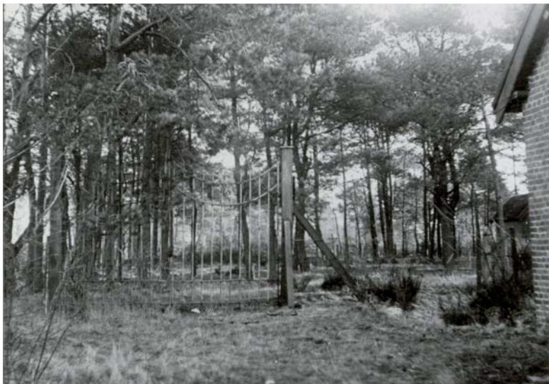
Het ( zomer ) huisje van de familie van de Ven naast de ingang van de begraafplaats

een gemeenteraadsvergadering gevraagd waar "Boschrust" is te vinden. Het antwoord is: aan de Hoogeindsestraat in Nieuw-Ginneken. Voor onderhoud van "Boschrust" is in 1961 f 250 uitgetrokken