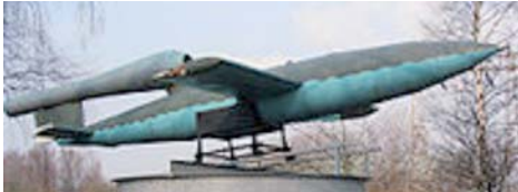
Een V1 in het museum te Peenemünde Duitsland. V is de afkorting van Vergeltungs-waffen

De Tweede Wereldoorlog is zeker niet aan Heusdenhout voorbij gegaan. In een eerdere 'Uit Heusdenhouts Historie' plaatsten we al de oorlogsherinneringen van Rinus Bartels. Ook in het eerder gepubliceerde verhaal van mevrouw Dien van den Wijngaart-van den Boer, onlangs 97 jaar geworden, speelt de oorlog een rol.