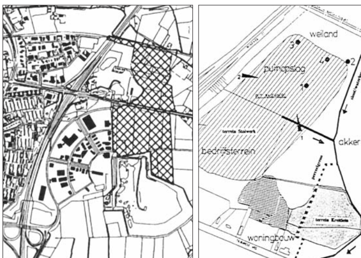
Zandwinning en opslaan van afval

Nog wat noordelijker ligt de op 3 oktober 1863 in gebruik genomen spoorweg. Dat spoorvak -van Breda naar Tilburg- was