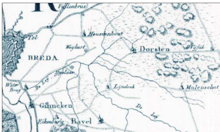
Situatie in 1815, deel van de 1e kaart uit www.Topotijdreis.nl

Een prachtige bron van geografische informatie vormt de site www.topotijdreis.nl van het Kadaster. Er worden topografische kaarten gepresenteerd waarvan de oudste stamt uit het jaar 1815. Dit gedeelte van die kaart toont het stroomgebied van de Leij. De Oosterhoutseweg -nog uit de plannen van Napoleon Bonaparte- is dan pas aangelegd, in 1813. Zie het rechte stukje door het woord Vuiljenbras.