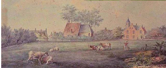
St. Annakapel, Mon Repos, Huize Weilust, Heerlijkheid Ijpelaar

centrum is, was eerder nog zo'n buitenplaats met als naam Mon Repos, Mijn Rust, aangelegd tussen 1754 en 1768. Later werd dit landgoed Charlottenburg genoemd naar de voornaam van de echtgenote van het paar dat het landgoed toen in bezit had.