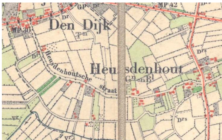
De Heusdenhoutschestraat op de kaart uit 1940 is eeuwen ouder dan de -rechte- Tilburgseweg rechtsboven.

In de oude vorm kent de Heusdenhoutschestraat een heel lange geschiedenis. Niet verwonderlijk voor zo'n oud dorp. Historicus Buiks kwam in oude geschriften -uit 1487- de naam Hoesenhoutstraetken tegen.