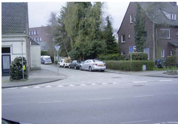
Het nog bestaande restant van de vroegere Heusdenhoutschestraat dat uitkomt op de Teteringsedijk.

De aansluiting komt op de Teteringsedijk uit tussen de woningen met de adressen Teteringsedijk 166 en 168.