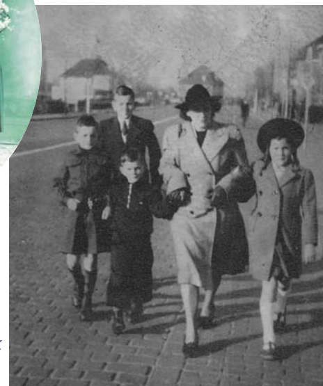
Moeder van Gils en haar kinderen in 1948 op de Teteringschedijk op weg naar de toenmalige kerk toegewijd aan Onze Lieve Vrouw van Goeden Raad aan de Driesprong