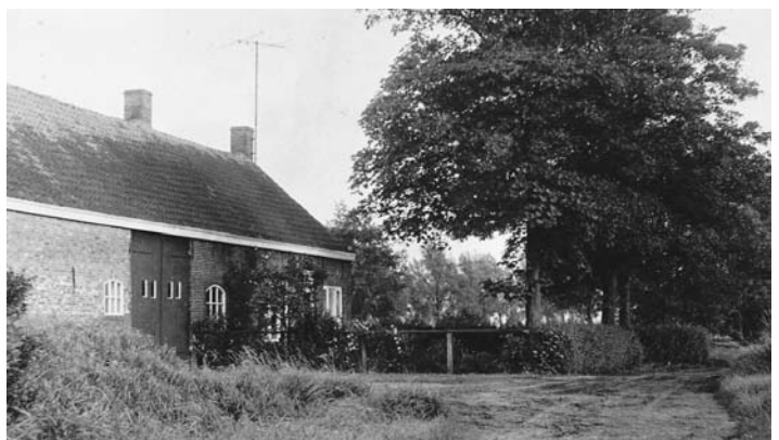
Boerderij te Beek, geboortehuis van Coby