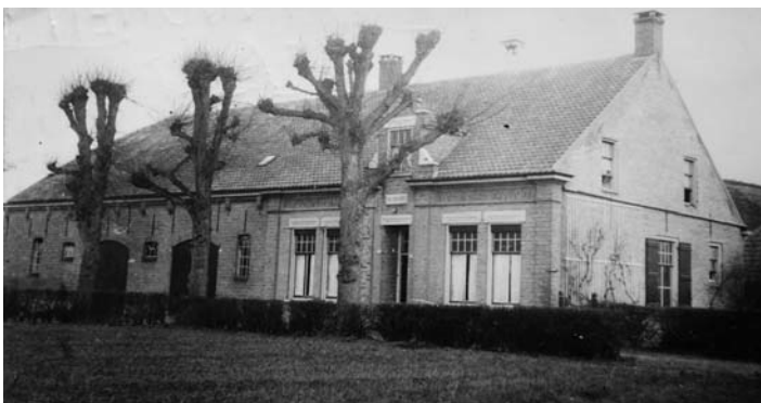
De Helenahoeve waar ik geboren ben