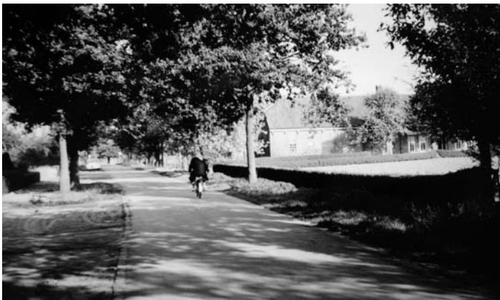
De -reeds verharde- Kapelstraat in vroeger dagen