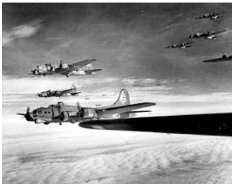
B17 bommenwerpers in formatie