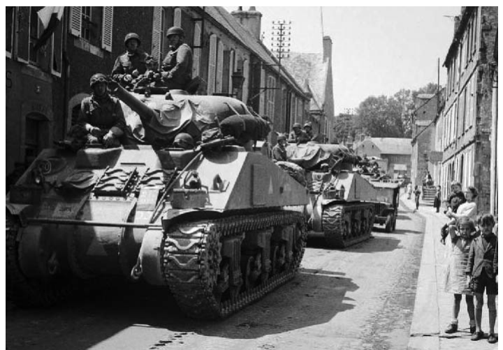
Sherman tanks, hier nog in Noord-Frankrijk

hardstenen omlijsting van het kelderraam waren enkele spijlen verwijderd. Er was de gehele nacht geschut te horen. We lagen tussen twee partijen. Het vliegveld Gilze-Rijen was verlicht met zoeklichten. Van de Tilburgseweg hadden we al enige tijd drie evacués in huis, omdat de Engelse Spitfires de spoortreinen beschoten en de buurvrouw van de betrokken familie hadden gedood. Het werd een spannende nacht. In de vroege ochtend kwam er nog een Duitse soldaat om onderdak vragen, maar mijn ouders durfden daar niet aan. De volgende morgen lagen onze 10 koeien dood in de wei. Op één van de koeien is nog een noodslachting toegepast. Die koe werd in de stal opgehangen en geslacht en over burgers uit de buurt en uit heel Breda verdeeld en meegenomen. 's Avonds was er niets meer over. In de vroege morgen was de toegang tot de straat een probleem geweest. Er