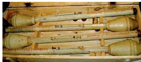
Pantseruisten zoals ze bij ons lagen

onder de bomen stond de gaarkeuken. Ik kreeg regelmatig soep van de Duitsers. Het waren Wehrmachtsoldaten, sommige erg jong. Er was geen spanning, het ging goed. Tot de dag vóór de bevrijding. Toen verdween de Wehrmacht en kwam de SS. De voorkamers in huis werden gevorderd en vol gelegd met kaarten en met munitie (pantseruisten). De straat werd vol mijnen gelegd. Buitengewoon onvriendelijk, buitengewoon spannend.