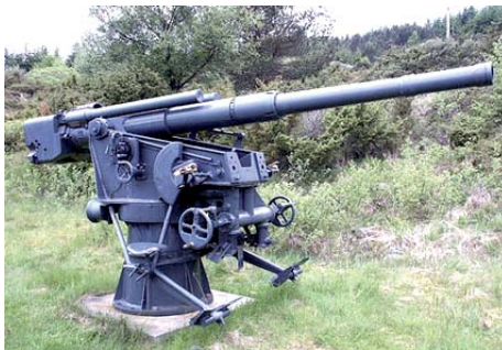
8.8 cm Flakgeschut

samenwerking met het bestuur van de toenmalige gemeente Nieuw-Ginneken uitgegeven door Heemkundekring Paulus van Daesdonck.