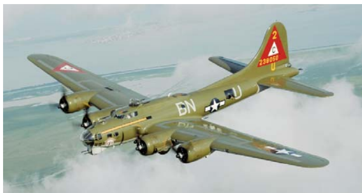
B17 'Vliegend fort'

“Het Flakgeschut van de Duitsers stond ondermeer opgesteld aan de Gilzeweg. Ik kwam er net langs toen het alarm begon te loeien. Razendsnel zaten de bemanningen achter de afweerkanonnen. Het afweergeschut werd ingesteld en bij één van de eerste salvo's werd er een vliegtuig getroffen. De andere vliegtuigen begonnen te zigzaggen om niet getroffen te worden. Het opnieuw instellen van de kanonnen kost immers tijd. Het toestel werd geraakt tussen motor 1 en 2, draaide zich op zijn rug om