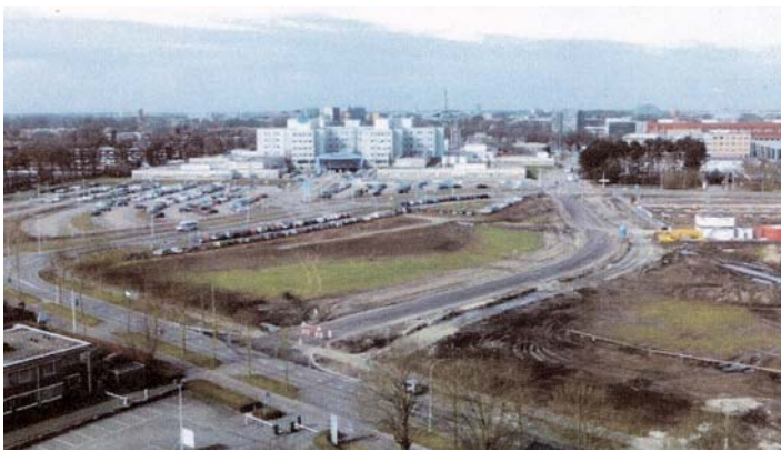
Van St. Ignatiusziekenhuis naar Amphia-ziekenhuis.

Molengracht: gezondheidszorg. Door verschillende fusies tussen ziekenhuizen was er behoefte aan een gezondheidscentrum. Daarvoor werd eerder een nieuw Ignatius ziekenhuis gebouwd aan de Molengracht met de naam Amphia, dat in 1990 in gebruik werd genomen. Door verdergaande fusies ontstond er nu behoefte aan nieuwbouw die eind juni 2019 werd opgeleverd. In 2020 werd begonnen met de verhuizing van de patiënten naar het nieuwe Amphiagebouw.