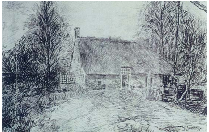
De boerderij van de familie Maas-Cornelissen, Poolseweg 153.

Daarmee zijn we aangekomen bij de huidige functie van de