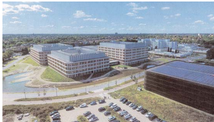
Van Amphia-ziekenhuis oud naar Amphia-ziekenhuis nieuw.

Heemkundekring Paulus van Daesdonck heeft in Ulvenhout een eigen museum. Elke eerste zondag van de maand en elke woensdagmiddag steeds tussen twee en vier uur is het gratis te bezoeken. Wilt u met een verhaal of met oude foto's bijdragen