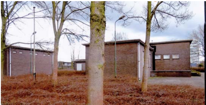
Het gebouw van het Korps Luchtwachtdienst aan de Korte Raamstraat.

Defensie had behoefte aan een effectieve luchtverdediging. Hiervoor werd in 1950 het Korps Luchtwachtdienst (KL) operationeel gesteld. Eén van de centra was het gebouw met bunker aan de Korte Raamstraat in Breda waarin ook een radarpost gevestigd was. Tot 2013 is het complex bij Defensie in gebruik gebleven. Het bestaat heden nog.