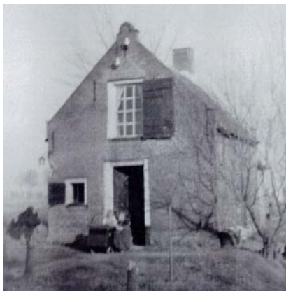
Het bakhuis van de familie de Jongh aan de overkant van de straat