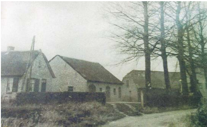
Herbouwde boerderij van familie de Jongh-van den Elshout, Poolseweg 203.

KMA-contracten. De levering van de boerderij aan de Staat der Nederlanden moet pachtvrij plaatsvinden in het voorjaar 1961. " In de Raadsvergadering op 15 juli 1964 werd door de heer Koertshuis de bovenstaande vraag gesteld: (zie bijlage). Niet lang daarna is het pand gesloopt.