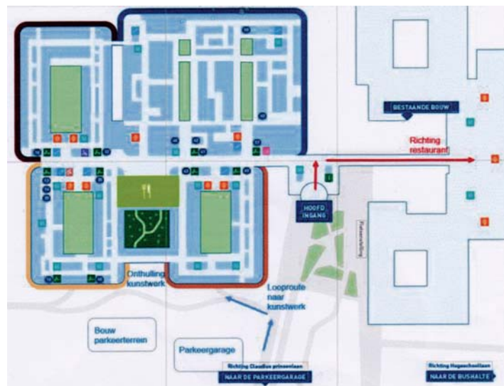
Plattegrond van de nieuwe situatie van het Amphia-ziekenhuis

aan de geschiedenis van Heusdenhout? Laat het ons weten via nieuws@heusdenhout.nl of 076 5810024.