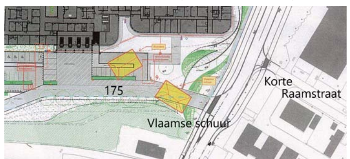
De positie van de boerderijen Poolseweg 175 en 177 aangegeven op de huidige plattegrond.

Weduwe Verdaasdonk-Coertjens verhuisde in 1961 van Poolseweg 177 naar de Bavelse laan 180 in Breda. Uit het raadsbesluit van de gemeente Breda komt de volgende passage: "...op 11 november 1959 heeft de Raad besloten om boerderij 177 uit de pacht te nemen. Dit is geschied ter uitvoering van de